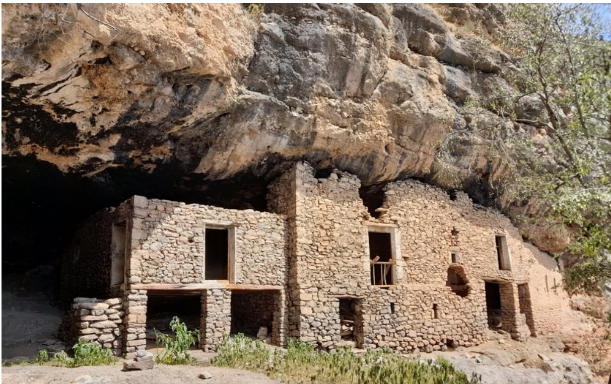
Espluga de Cuberes

La amplia experiencia de RehabiMed en actividades de formación práctica en el Mediterráneo permitirá crear un equipo de trabajo interdisciplinar, con profesorado universitario, expertos locales y jóvenes profesionales, de diversos países, aunados en un objetivo común.