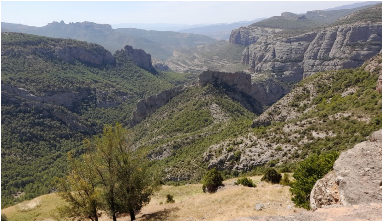
Entorn paisatgístic de treball

El Taller desenvoluparà activitats de recollida de dades sobre el terreny i d'elaboració de la informació recollida. També s'organitzaran conferències i debats tècnics, i visites a indrets similars de la zona.